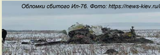
Обломки сбитого Ил-76.